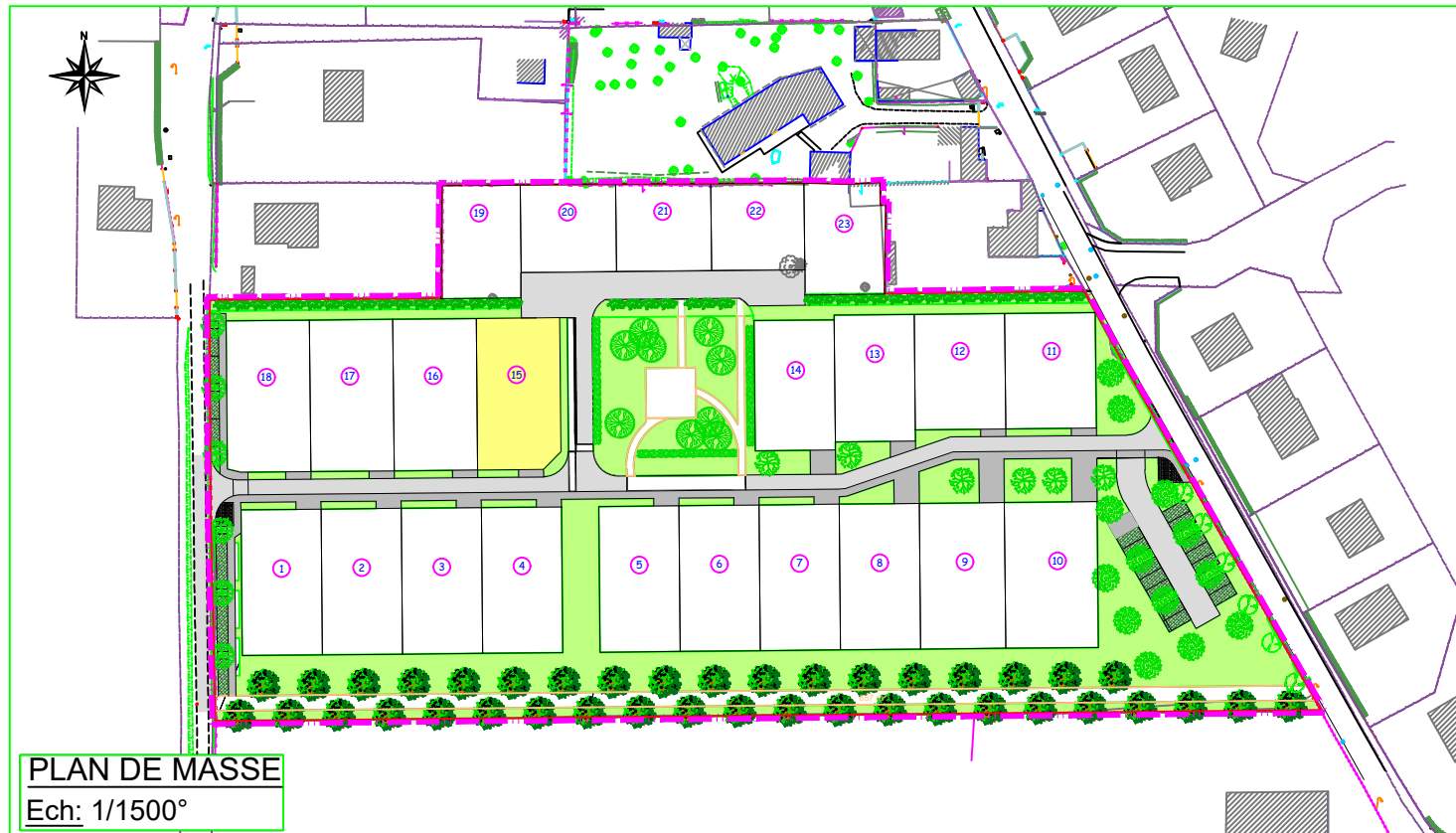
PLAN DE MASSE Ech: 1/1500°